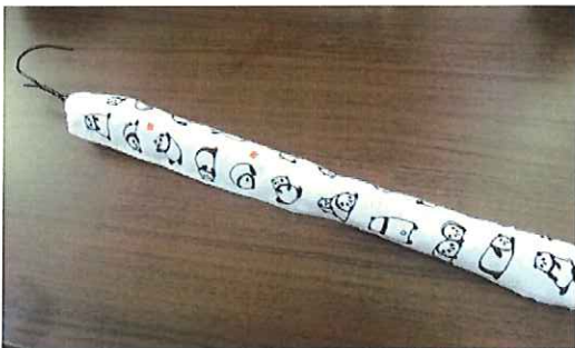
③お好みでカラーテープや手ぬぐい などを巻いて持ち手を作って完成☆