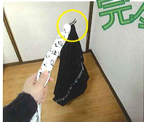
床に落ちたものをハンガーのフック 部分で引っかけて拾えます♪