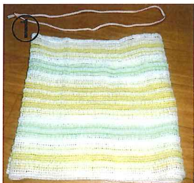
①紐はくくって輪か状にする