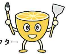
大会キャラクター リハモン