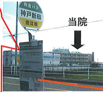
蟹江駅 → 神戸新田

蟹江駅から「公民館分館行き」のバスへ乗車し、「神戸新田(かんどしんでん)」で下車すると奥に当院の建物が見えます。