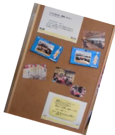
病院の1階事務所 横にも活動内容が掲示！