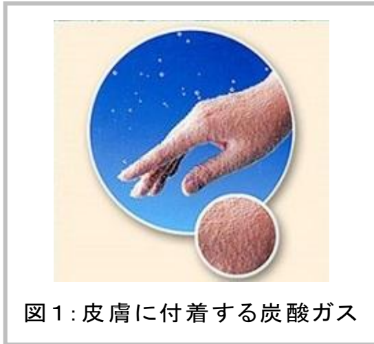
図1:皮膚に付着する炭酸ガス

炭酸泉には、他の温泉には無い独自で明確な作用があることが医学的にも証明されています。炭酸泉に入浴すると、細かな泡が付着し、まるでラムネやシャンパンの中に入っているように感じられます(図1)。これは、炭酸ガスが皮膚の毛穴から毛細血管の中に吸収されるために見られる現象であり、10分程度入浴した後は、お湯につけていた部分がはっきりと紅潮していることが確認できます(図2)。