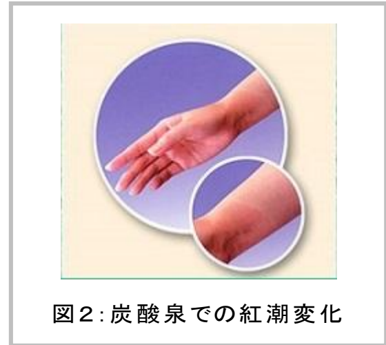
図2:炭酸泉での紅潮変化

これは、その部分の血流が改善したことの証明であり、通常の入浴に比べても3倍程度高い血流改善効果を得られます。(図3)